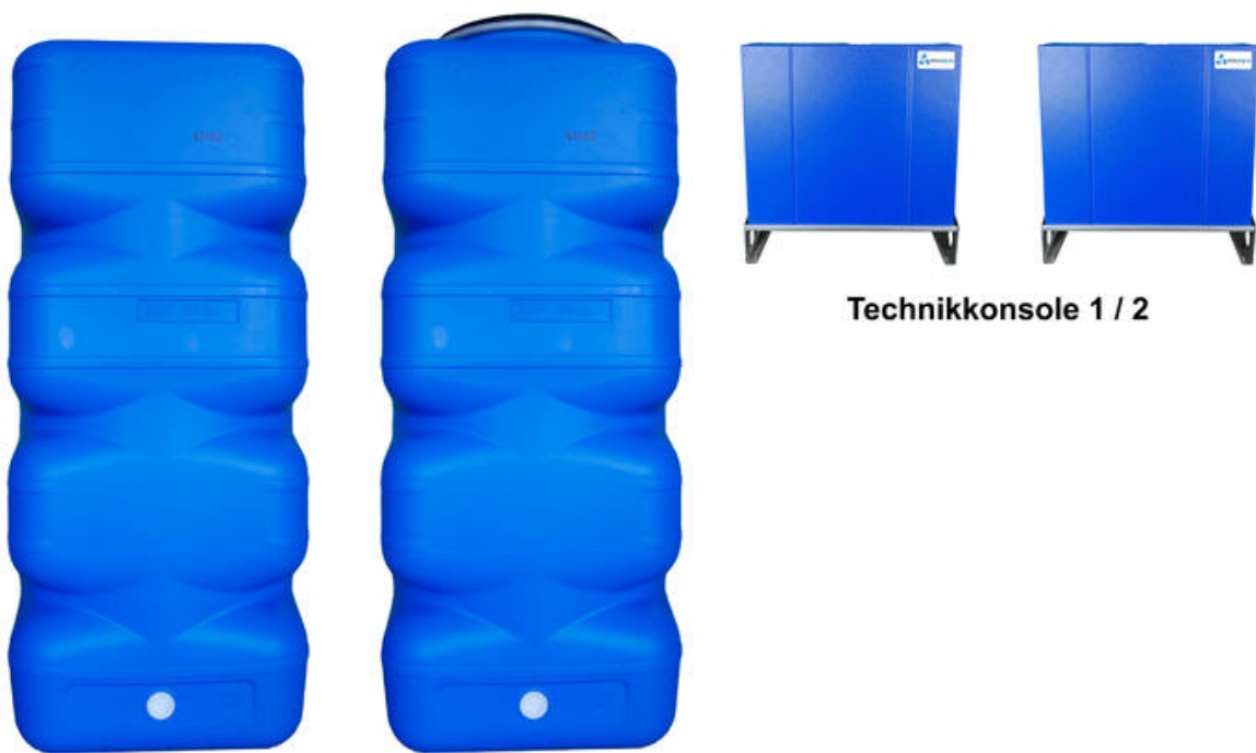
Betriebswassertank Grauwasser -/ Filtrationstank