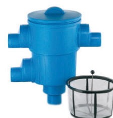
GartenFilter L für Tankeinbau