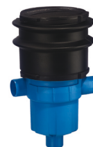
GartenFilter S mit Teleskopverlängerung