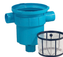
GartenFilter S für Tankeinbau