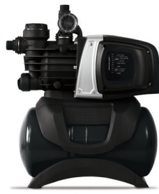
ecoMatic 4-50 L

Hauswasserwerk mit hochwertigem Ausdehnungsgefäß (19l) und wassergekühlter Jetpumpe zur Trockenaufstellung. Das Hauswasserwerk ist mit einem internen Sauganschluss auch für große Wassermengen geeignet, da die Reibungsverluste minimiert werden. Die selbstansaugende, einstufige Jetpumpe und der externe Druckschalter sind aus hochwertigen Materialien gefertigt.