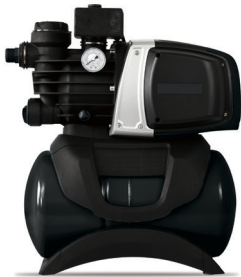
ecoMatic 3-40 S und ecoMatic 4-50 S